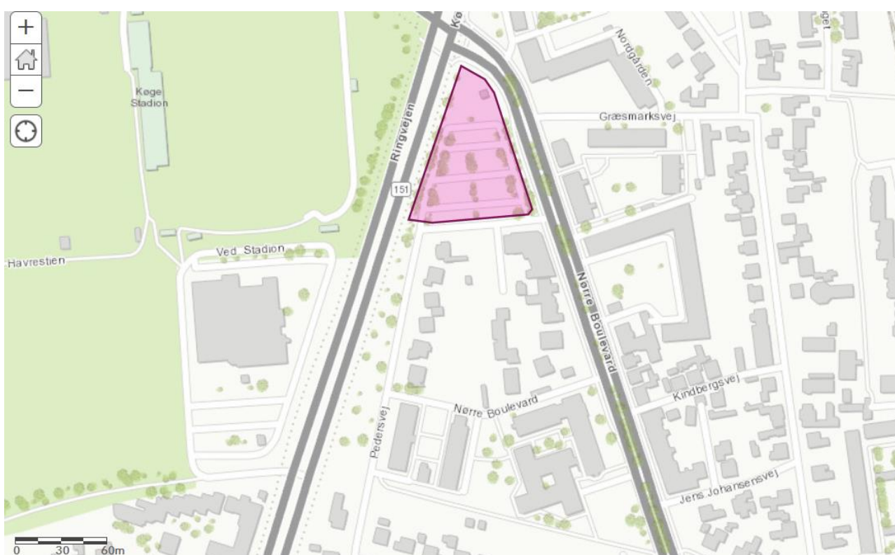
Fig. 1. Udtalelsesarealet vist som rød figur. Areal 5222 km 2 .

I mail af 3. januar 2023 anmodes Museum Sydøstdanmark om udtalelse vedr. areal matr. 11xa, Køge Markjorde (se fig. 1) forhold til Museumsloven §25.